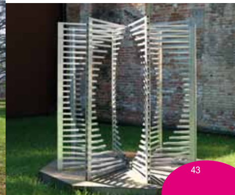
Manfredo Massironi, Sfera negativa