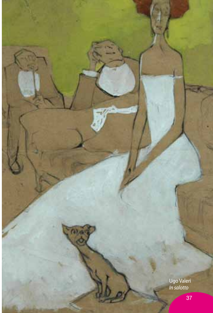
Ugo Valeri In salotto