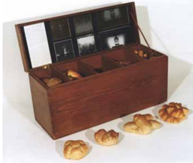
"La mostra del pane, 18 marzo 1961" Documento autografo in cassetta di legno cm 24 x 51 x 18

infocultura@comune.padova.it - http://padovacultura.padovanet.it