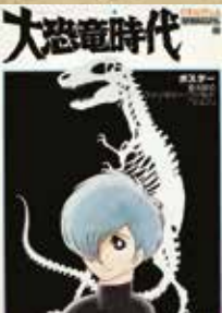
Dai Kyoryu Jidai Ed. Tokuma Shoten

Venerdì 16 dicembre 2016 ore 18 Centro culturale Altinate San Gaetano via Altinate 71