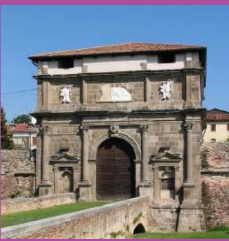
PORTA SAN GIOVANNI