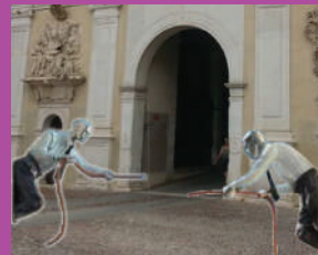
"CARIATIDI" Installazione di PAOLO PIN Porta Ognissanti