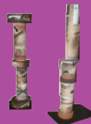
"GUARDIANI" Installazione di ALFREDO DEL SANTO Porta Santa Croce