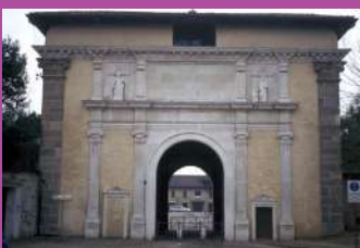
PORTA SANTA CROCE