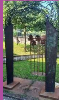
"PORTALE DEI SOGNI" Installazione di DOMENICO SCOLARO Porta Savonarola