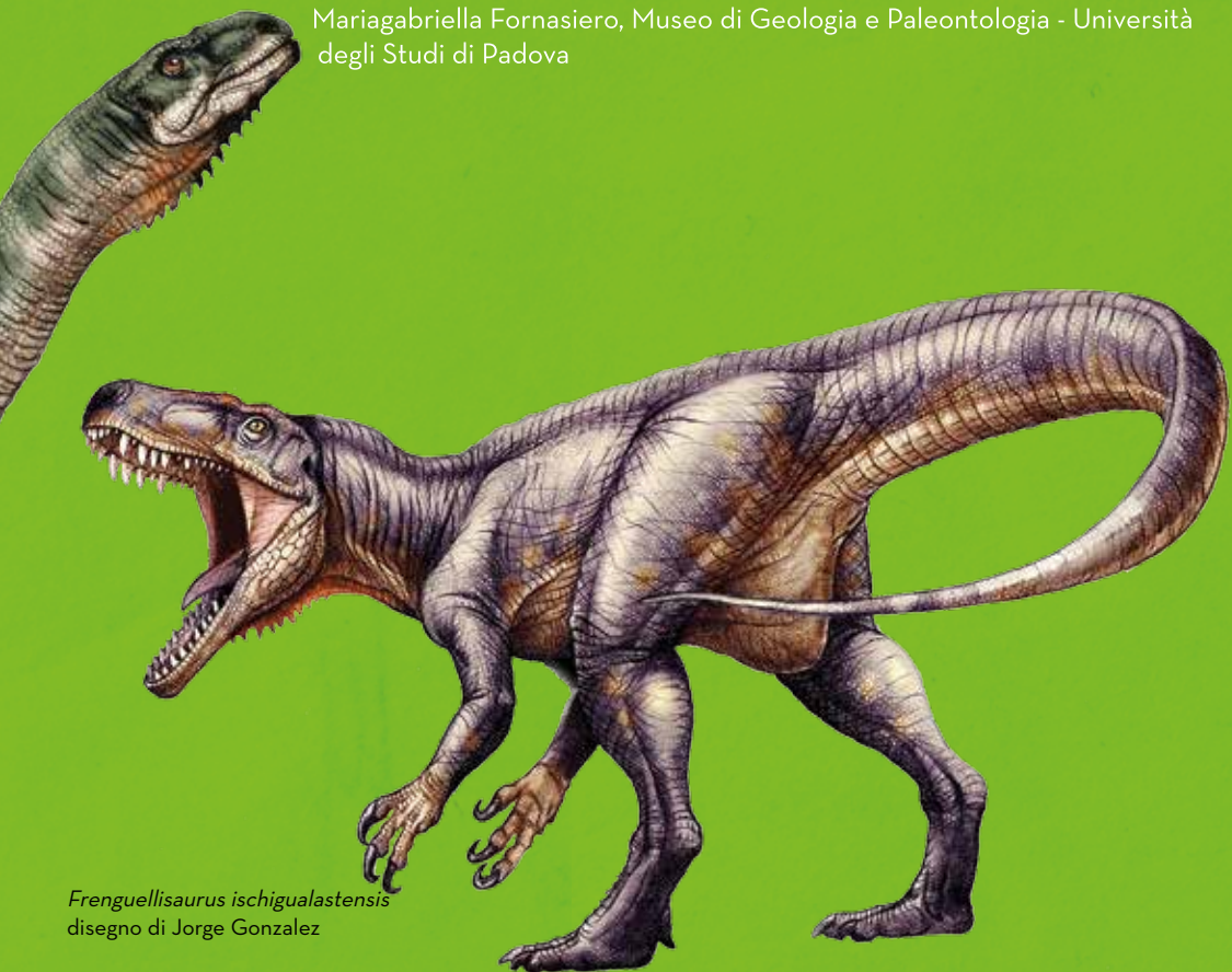
Freguellisaurus ischigualastensis disegno di Jorge Gonzalez

Mariagabriella Fornasiero, Museo di Geologia e Paleontologia - Università degli Studi di Padova