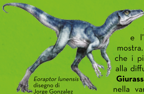
Eoraptor lunensis disegno di Jorge Gonzalez

Attraverso un percorso cronologico, la mostra ripercorre l'intera storia dell'evoluzione dei dinosauri partendo dal Triassico , che nonostante la scarsa diversità delle specie terrestri e marine della flora e della fauna, ha lasciato importanti testimonianze nelle