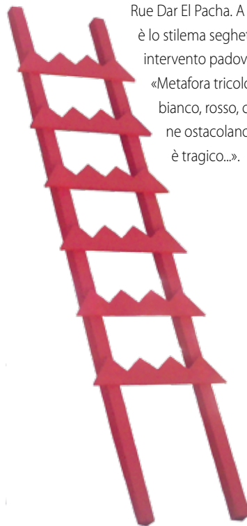
Ripiditalia legno dipinto cm 400x100 2014 proprietà dell'artista Padova

«Metafora tricolore composta da tre scale di color verde, bianco, rosso, con i gradini a denti di sega rivolti all'insù che ne ostacolano l'uso. Salire è sempre più difficile, scendere è tragico...».