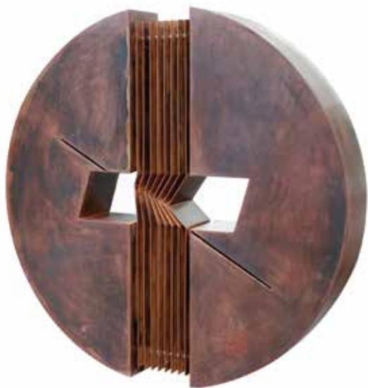
Smetti di toccare acciaio corten cm 99x18 2006