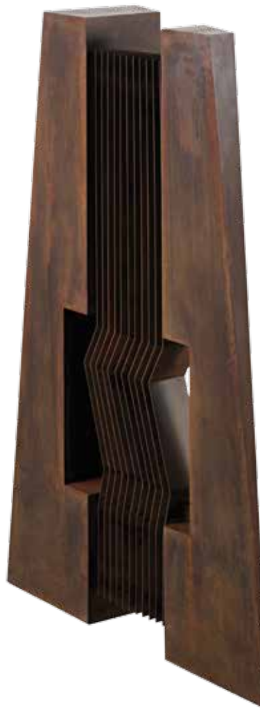
Sospeso fra due acciaio corten cm 120x76x26 2006 courtesy Archivio Alberto Biasi Padova

Le sculture di Alberto Biasi, realizzate in acciaio corten, sono caratterizzate da un serrato dialogo tra vuoti e pieni, in cui la luce colpisce e penetra la superficie, attraverso le fenditure, in una continua alternanza di piani. In queste opere, il movimento, sia reale che virtuale, è assente. La staticità che contraddistingue tali sculture è tuttavia solo apparente. Il dialogo dell'opera con la luce naturale determina infatti una vibrazione, che ha luogo nel cuore stesso della scultura e si propaga allo spazio in cui è inserita.