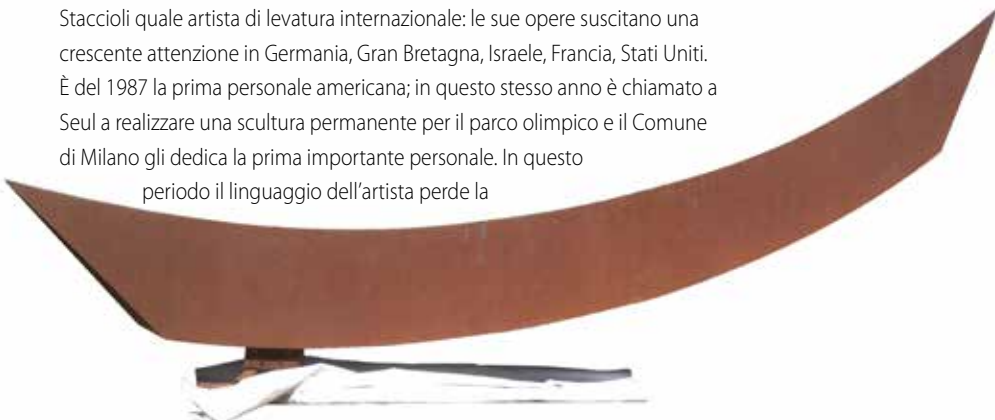
Segno aperto acciaio corten cm 200x576x35 2003

Esegue numerosi interventi in spazi pubblici e privati in Italia e all'estero, tra cui l'ormai celebre Equilibrio sospeso al Rond Point de l'Europe a Bruxelles (1998). Nel 2011 vengono presentate a Catanzaro due importanti mostre monografiche dal titolo Cerchio imperfetto .