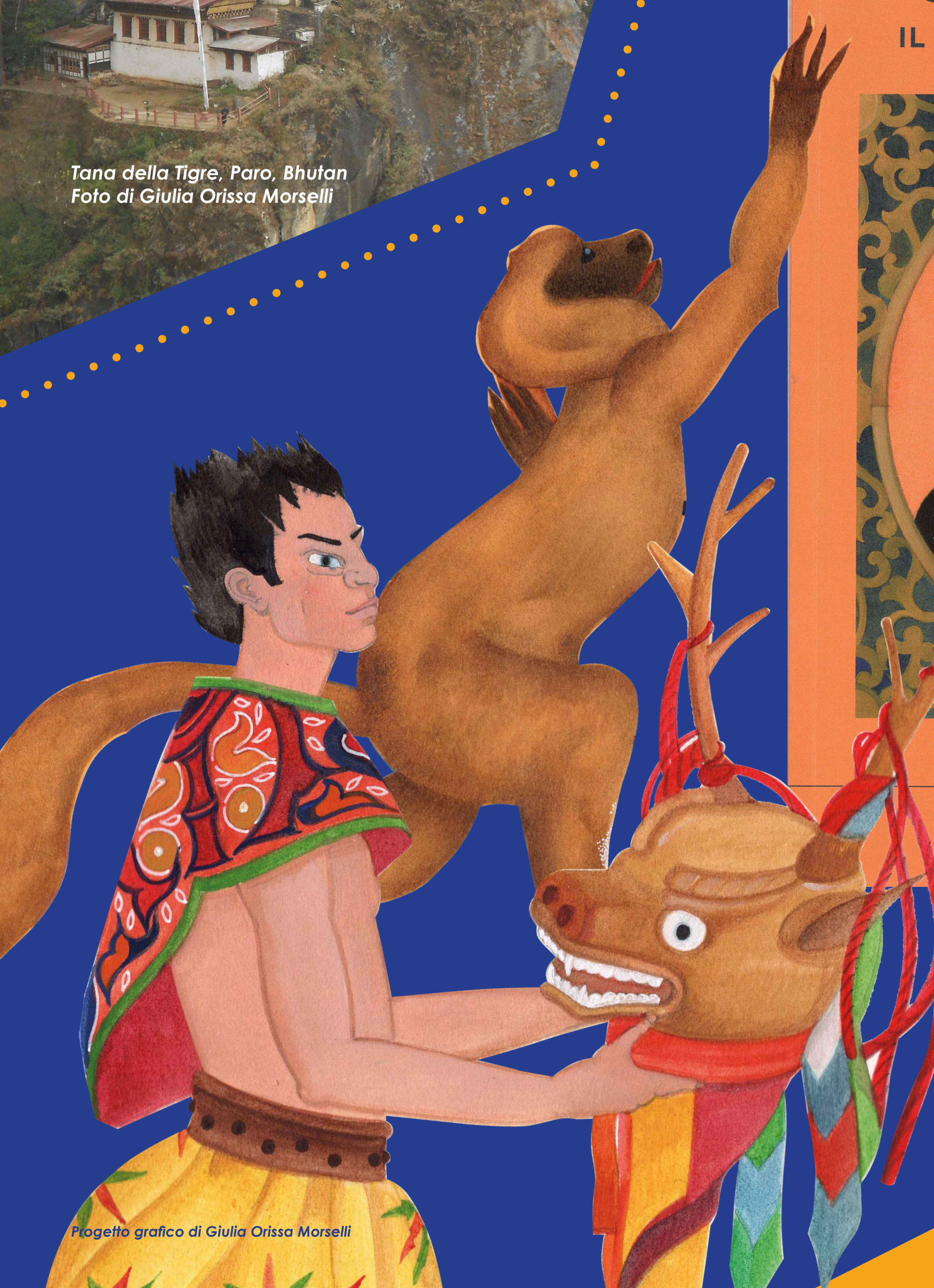
Progetto grafico di Giulia Orissa Morselli

“Un’esperienza di lettura dedicata ai ragazzi e a insegnanti, genitori, nonni, viaggiatori reali e aspiranti tali, interessati ai valori e alle culture di altri Paesi”