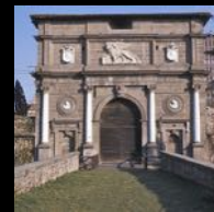
La porta più elegante, opera di Falconetto

Un'app mobile , con contenuti scaricabili in ciascuna stazione, che vi guiderà alla visita di quella porta o di quel bastione, descrivendovene ogni dettaglio . Oppure, se lo preferite, conducendovi in un viaggio nel tempo , attraverso l'iconografia storica o mediante ricostruzioni 3D e realtà aumentata