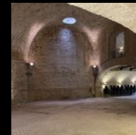
Il bastione dagli ambienti affascinanti

TORRIONE ALICORNO via Cavallotti o via S. Pio X