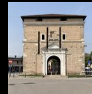
La prima porta delle nuove mura

TORRIONE ALICORNO via Cavallotti o via S. Pio X