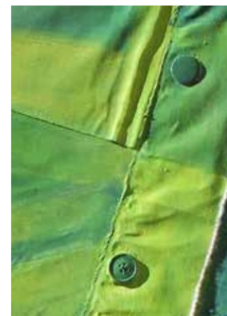
Dettagli dalla serie "Frammenti"