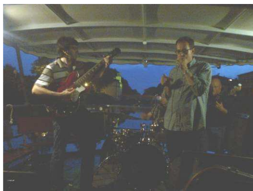
Il Blues del Piovego

La Blues Boat Band è formata da 4 musicisti di lungo corso, e che si conoscono da lunga data. Hanno spesso “provato” nella sede degli Amissi del Piovego, e grazie al Blues ONDE Piovego, concerti di blues “in navigazione”, hanno l’occasione di ritrovarsi e di far sentire “la loro” sul blues.