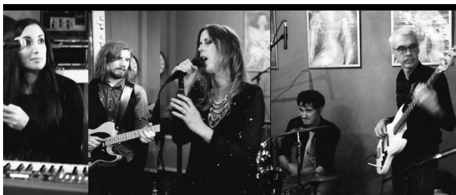
Tribute to Ben Harper's World

Il progetto dei The Innocent Lies nasce nel 2011 grazie alla passione condivisa di cinque ragazzi per un grande Artista, Ben Harper, la cui discografia è carica principalmente di blues e di funky.